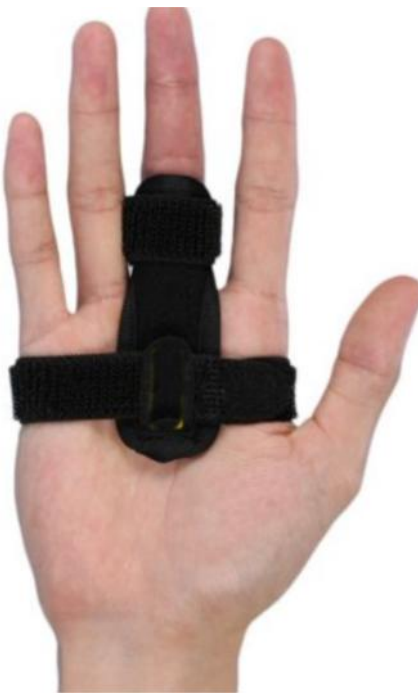
Tutore notturno per dito a scatto

La puleggia A1 è la responsabile del restringimento del canale – il tendine appare ingrossato